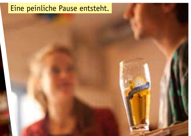
Eine peinliche Pause entsteht.