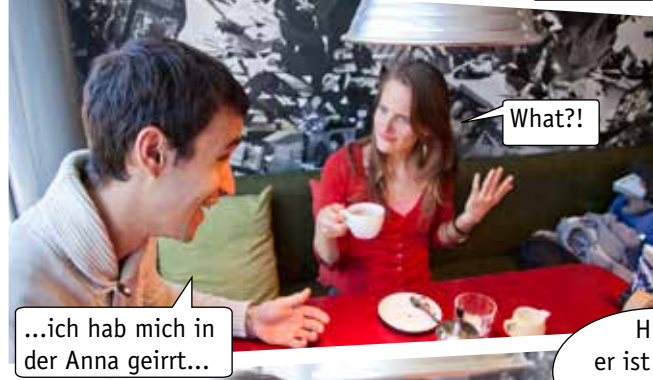
Hm, er ist schon ein Schnuckel!