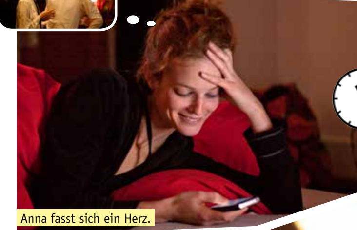
Anna fasst sich ein Herz.