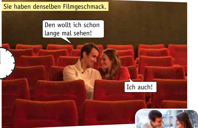
Sie haben denselben Filmgeschmack.