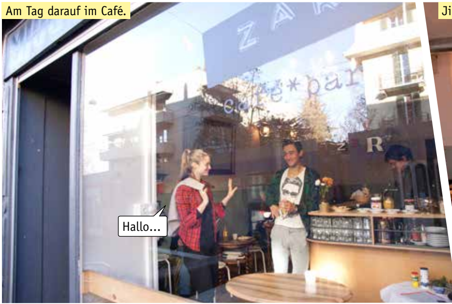
Am Tag darauf im Café.